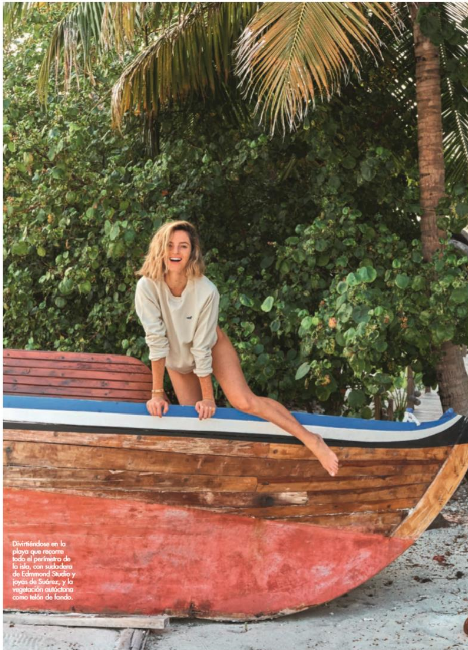
Divirtiéndose en la playa que recorre todo el perímetro de la isla, con sudadera de Edimmond Studio y joyas de Suárez, y la vegetación autóctona como telón de fondo.